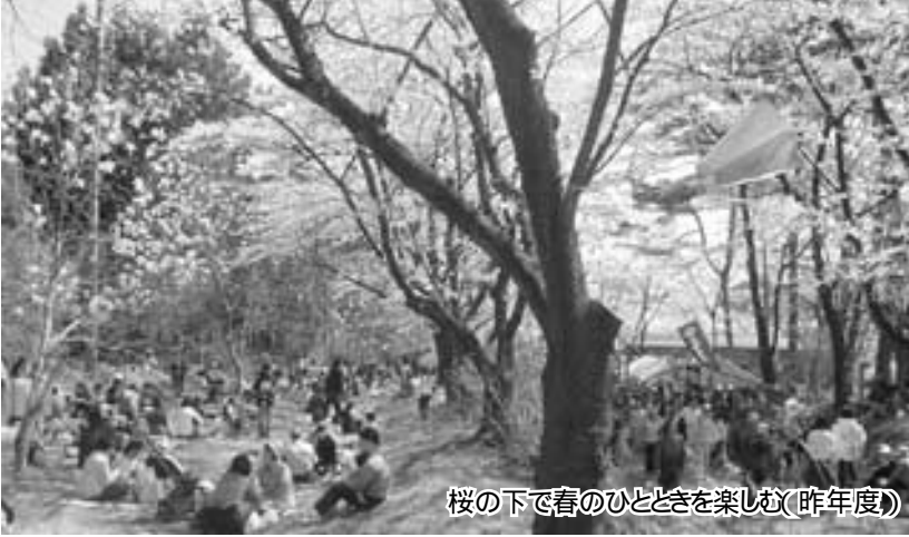
桜の下で春のひとときを楽しむ(昨年度)

赤城南面千本桜は、国道353号三夜沢交差点を東へ一・五の所にあります。約二にわたって樹齢五十年のソメイヨシノが千本植えられ、満開時には桜のトンネルに、毎年多くの観