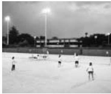
スポーツでリフレッシュ

日時 8月25日～9月8日の月木曜五回、午後6時30分～8時30分 対象 初心者、先着