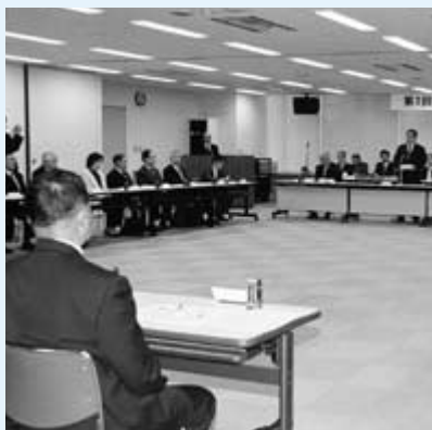
合併に向け入念な協議

第六回前橋広域市町村合併協議会と合併協定調印式が、次のとおり開催されます。調印式は、二十四項目の協議結果を、協定書として四市町村長が調印する式典です。