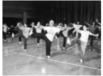
楽しく健康づくりを

対象 中学生以下を除く、三十人(抽選) 参加費 二千元 申し込み 9月15日 (必着) までに往復八ガキで