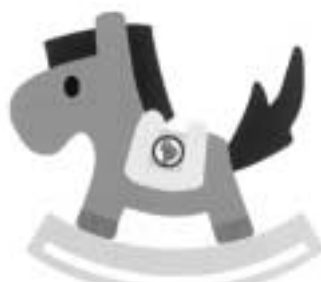
冬季国体のシンボルマーク

ーガン・シンボルマークに沿うもの。国体スケート競技・アイスホッケー競技への興味を喚起するもの 申し込み〓 5月31日 (必着) までに郵送で。住所・氏名(ふりがな)・年齢・性別・職業(学校名)・学年・電話番号・作品の簡単な説明を明記し、〒371 8570冬季国体推進室「公式ポスター募集係」(26 4741)へ。その他 〓 最優秀作品は広報に使用。補筆することもあります。応募作品は返却しません