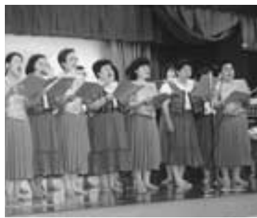
懐かしい曲を美しいハーモニーで