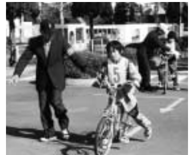
自転車の乗り方練習会

いる 母が婚姻しないで妊娠した。その他平成10年4月1日以降に支給要件を満たしていれば請求可。ただし、母・養育者などがほかの公的年金(老齢福祉年金を除く)を受給していたり、所得が基準額を超えていたり、児童が児童福祉施設へ入所していたりすると支給されません。なお、偽りなどの不正な手段で手当を受けたときは法令によって罰せられることがあります。問い合わせは児童家庭課 890-6277へ。