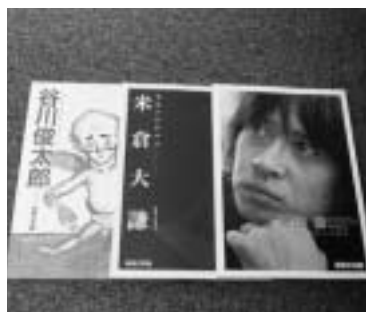
10年の歴史を振り返る

・図録などを展示する回顧展を開催します。開催中はすべての図録を八百円で販売します。 日時 6月14日～8月31日、午前9時30分～午後5時(入室は4時30分まで)