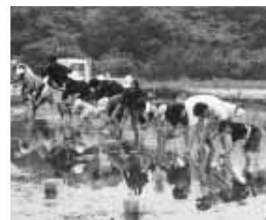
昨年は米作りを体験

自治総合センターでは、宝くじの収益でコミュニティへの支援を行っています。地域の発展のため、次の事業に助成を行いました。 □城東地区自治会連合会 集会用テント、机、折りたたみいす、スポーツ用具の購入。 ○…問い合わせは生涯学習課 ☎890-5822へ。