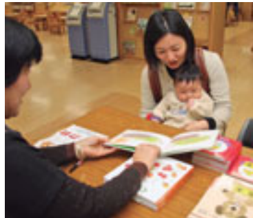
内容を見ながら選べます