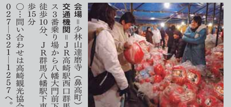
大小さまざまなだるまが並ぶ

新年の風物詩「少林山七草大祭 だるま市」を開催します。会場と なる少林山達磨寺は、だるまを売 る露店などがずらりと並ぶほか、 無病息災や商売繁盛を祈願したり、 だるまを供養したりする人たちが 大にぎわい。なお、会場周辺は交 通規制を行うため大変込み合いま す。来場には公共交通機関をご利用 ください。