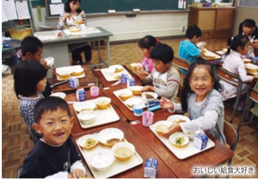
おいしい給食大好き

■学校給食と食育 子どもたちが毎日食べている学校給食。本市はこれを重要な食育の時間と考え、調理場の栄養士が食事についての話を「食の指導」や、地元で生産された食材を積極的に取り入れる「地産地消」などの取り組みを行っています。中でも地産地消は、新鮮で安全な食材を提供できるだけでなく、身近で