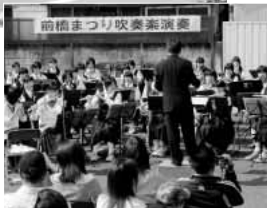
中学生が奏でる美しいハーモニー