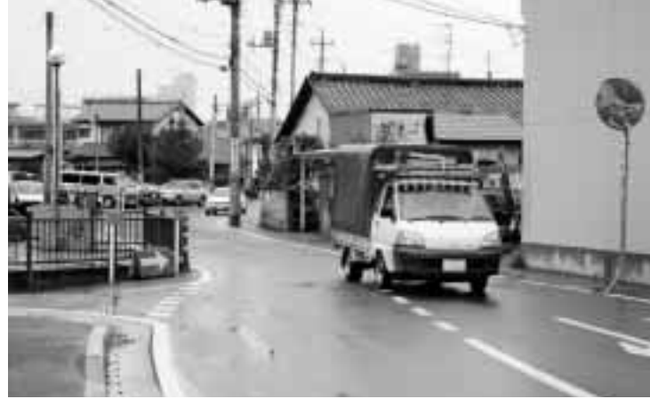
道路を広げて通行をスムーズに