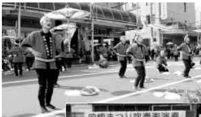
そろいの法被で八木節を