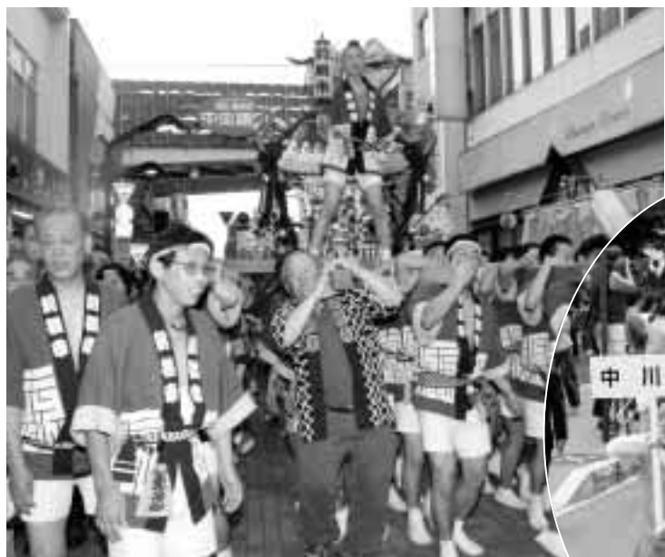
友好都市メナーシャ市のロークス市長もみこしに飛び入り