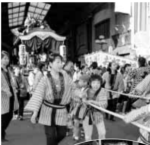
アーケードの屋根ぎりぎりを通る山車