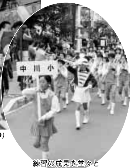
練習の成果を堂々と