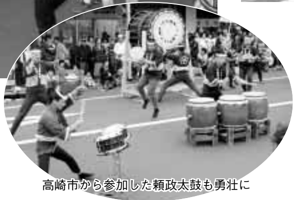
高崎市から参加した頼政太鼓も勇壮に