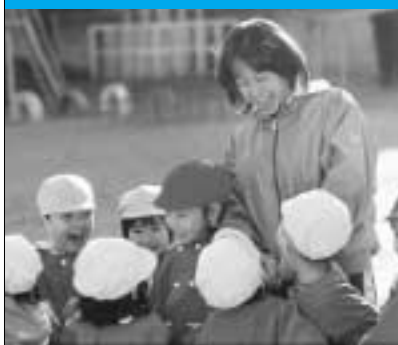
子どもと語る保育士

1月1日 から2月29日 まで「はたちの献血」キャンペーンを実施。年間を通じて血液は医療で必要とされていますが、これからの寒い時季は献血の協力者が特に少なくなります。献血車を見掛けたら協力をお願いします。 ...問い合わせは生活課 890-6237へ。