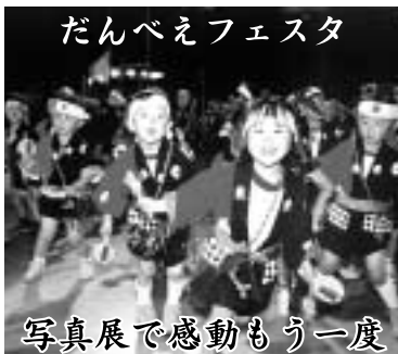
写真展で感動もう一度

日時〓 8月26日 〓 30日、午後6時30分〓8時30分 会場〓 東日本電子・商科専門学校(小屋原町) 対象〓 中小企業従事