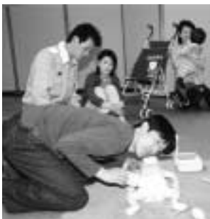
乳児コースもあります

日時 6月1日 午後1時30分～4時30分 会場 広域消防本部 対象 中学生以上、先着六十人(乳児コース二十人・成人コース四十人) 内容 心肺蘇生法、止血法などの応急手当で申し込み 5月19日～26日に消防本部警防課 220 4513へ、各消防署・各分署へ