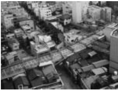
活性化のため中心商店街の出店を支援

対象〓新たに中心商店街の空き 店舗を活用し、小売業、飲食業 サービス業を出店する人 補助 対象〓家賃、店舗改装費の一部 申し込み〓6月15日 までに所