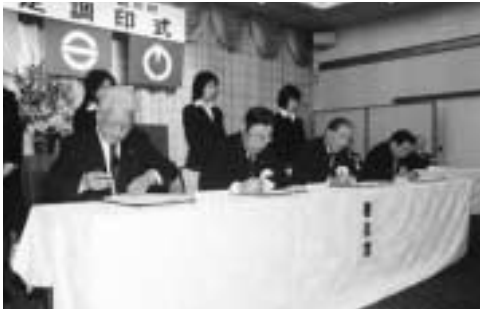
協定書に署名する4市町村長

条例・規則など 原則として前橋市の条例、規則などを適用。ただし、必要に応じて、合併と同時に所要の改正などを行います。 町名・字名 大胡町・宮城村・粕川村の町名・字名は、各町村の意見を尊重し、下表のとおり。 市章・市民憲章など 市章、市民憲章、市の木・花、市の歌などの慣行は、前橋市の制度に統一します。ただし、現在の三町村の慣行は、それぞれ地区の慣行として継承・伝承します。 土地利用 都市計画区域や区域区分については、土地利用規制の急激な変化を避けるため、現行のまま新市に引き継ぎます。合併から十年後に都市計画区域を統合し、市街化区域と市街化調整区域の