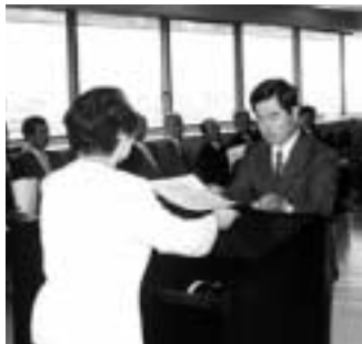
委員に当選証書を付与

六月三十日に告示された市農業委員会委員選挙は、定数と同数の三十人が立候補し、無投票で委員が決定。七月八日、石井選挙管理委員長から当選証書が付与されました。