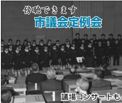
議場コンサートも

12月3日から18日まで、第4回市議会定例会が開かれます。10日と11日に、議案や市政についての総括質問が行われる予定です。