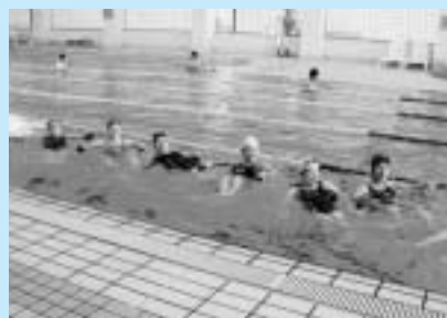
無理なく楽しく健康づくり

動教室を開催しています。水中ウォークや県内ではめずらしい棒状の浮き「ヌードル」を利用した運動など、無理なく楽しみながら健康づくりができます。参加費は一回千円。施設利用料は実費負担です。腰痛や関節痛で悩んでいる人は、ぜひ一度試してみませんか。