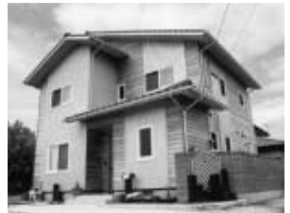
新築した家に伺います