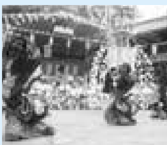
3頭の獅子が華麗な舞を

月田近戸神社ささら（粕川村） 期日 9月1日 会場 月田近戸神社境内 内容 獅子舞 問い合わせ 粕川村観光協会 285 6753