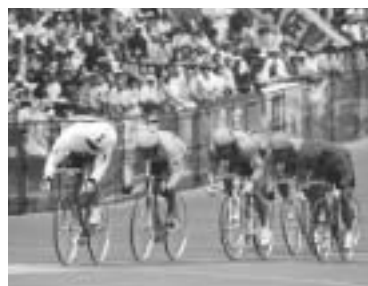
栄冠目指し力走する選手

十一月二十四日 から二十七日 まで、記念競輪「三山王冠」を開催。一流選手の白熱した戦いをグリーンドームでご覧ください。問い合わせは事業課 231 4508へ。