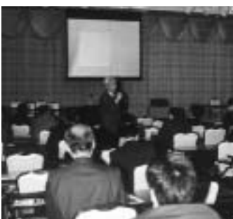
昨年の産学官連帯フェスタ