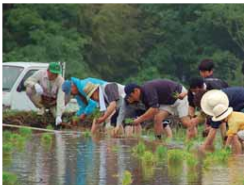
家族で楽しく体験を

期間 5月～12月 会場 室沢棚田地区 対象 市内在住の家族・グループで4人1組、20組(抽選) 費用 1組5,000円と負担金(大人1,000円、子ども500円) 申し込み 3月7日(金)までにフアクスで。住所・参加者全員の氏名・年齢・電話番号を明記し、室沢地区棚