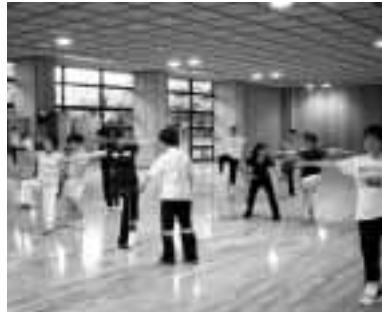
たいそうを広めて健康に

元気ひろげたいそうの普及 員養成講座を開催します。 日時 3月23日(金)午前9時～ 午後4時 会場 総合運動公 園 対象 市内在住・在勤の 人、先着二十人 内容 元氣 ひろげたいそうの講義と実技 申し込み 3月22日(木)までに 施設管理公社 ☎224-11612 へ