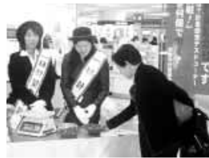
計量イベントに参加を

自治総合センターでは、宝くじの収益でコミュニティ助成事業を行っています。これは、宝くじの普及と地域の健全な発展が目的。次の自治会連合会が、この