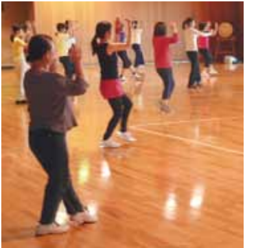
エアロビで有酸素運動を

□コアコンディショニングインストラクターセミナー 日時 4月10日(水)午後6時〜9時 対象 中学生以下を除く、先着10人 費用 6,300円 □3月30日(土)までに同館へ 大渡温水プール・トレーニングセンター ☎253-7811