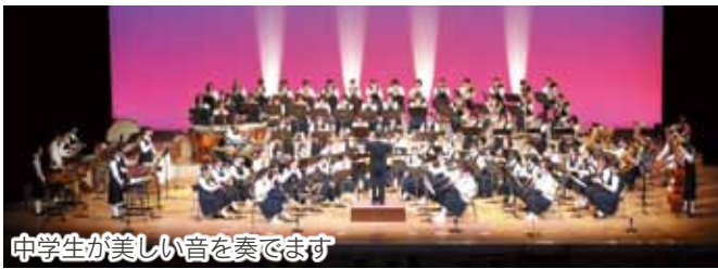
中学生が美しい音を奏でます