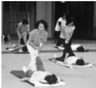
柔軟な体をつくろう

日時 9月2日～11月4日の金 曜八回、午前10時～11時30分 対象 中学生以下を除く、四十