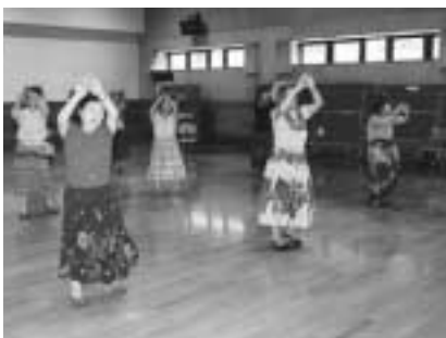
体育館で汗を流す利用者

教室名〃 ラウンドダンス 中国人講師による本格派太極拳の一日体験 日時〃 8月28日 〃 11月27日の木曜10回 は8月23日、いずれも午後1時〜3時 対象〃 は60歳以上、三十人(抽選) は一般、先着五十人 参加費〃 無料(65歳未満は入場料実費負担) 用意する物〃 上履き 申し込み〃 は8月16日(必着)までに往復八ガキで。教室名・住所・氏名(ふりがな)・年齢・生年月日・性別・電話番号を明記し、〒371