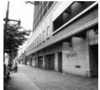
国道17号沿いのシーズポート

〓月額五万一千八百四十円 管理費〓月額七千七百十九円 敷金〓家賃三カ月分 申し込み〓7月16日 までに市役所商業観光課(890 6602)へ直接