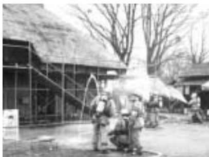
万一に備えて訓練（昨年度）

排水設備工事には専門的な技術が必要なので、水道局の指定を受けた業者でなければ工事はできません。工事を依頼するときは、必ず指定工事店であることを確認してください。また、すでに下水道に接続されている建物で、建て替えなどのため下水道を使用したまま下水道の使用を一時中止するときは、事前に水道局へ届け出てください。問い合わせは下水道管理課 890 3075へ。