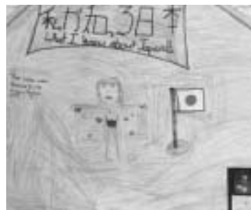
アメリカ児童の作品