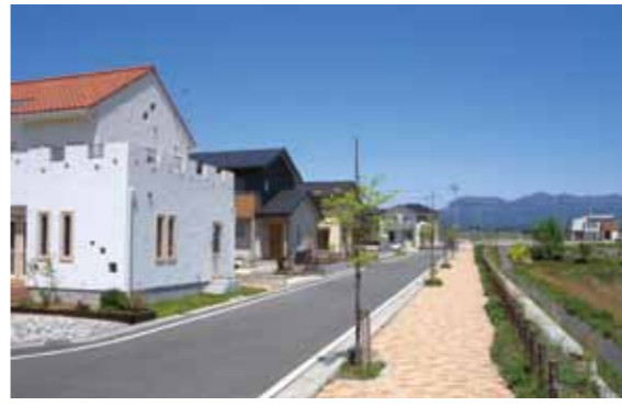
上武道路が近く利便性の高いまちです

ローズタウン住宅団地(東地区)にマイホームを建てませんか。現在、宅地を分譲中。好評につき、4区画を残すのみとなりました。美しいまち並みと利便性の良い立地が魅力の住宅団地です。ぜひ、ご検討ください。分譲区画・面積:4区画(240・70平方メートル・256・54平方メートル)分譲価格:1区画824万4,000円から