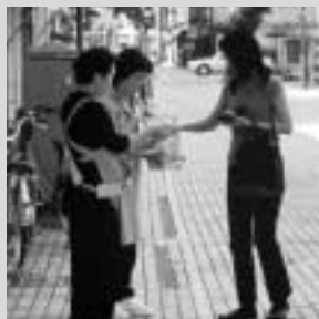
社会福祉のために

地域の子どもを地域で守り、育てるために「青少年健全育成大会」を開催します。 日時〓10月18日 午後1時30分 会場〓市民文化会館 対象〓一