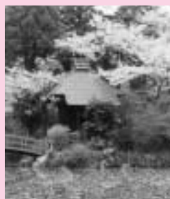
池が花びらでいっぱい