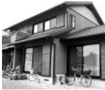
対象区域には調査員が伺います