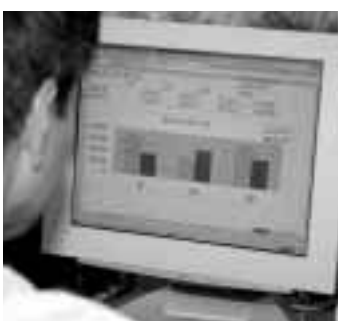
エクセルの基礎を学ぼう

日時 6月22日～9月14日の 木曜十二回、午後6時30分～ 8時30分 会場 総合教育プ ラザ 対象 市内在住・在勤 (パート可)でパソコンの基本 操作ができる人、十五人(抽選) 内容 ワード・エクセル基礎 参加費 二千円 申し込み 6月12日(月)までに往復ハガ キで。住所・氏名・年齢・職 業・電話番号を明記し、市役 所商工振興課「パソコン初級 講座係」(☎89016617) へ