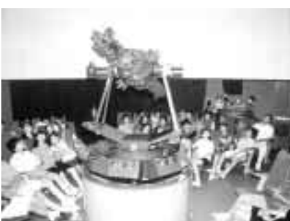
みんなで楽しく星座を観察

□押し花の万華鏡を作ろう 日時 6月18日(日)午後1時30 分～3時30分 対象 小学生、 二十人(抽選) 6月11日(日)午 後1時に公開抽選 内容 色 鮮やかな押し花を使った万華 鏡作り 参加費 八百円 申 し込み 6月10日(日)(必着)