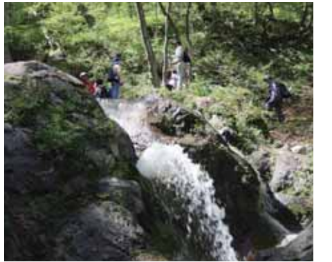
幻想的な滝めぐりを