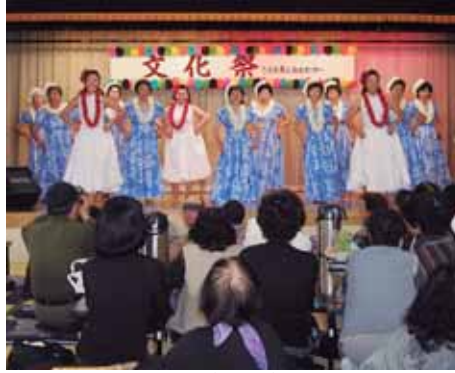
多彩な舞台発表 (昨年)

対象地区＝〈認知症高齢者グループホーム〉永明地区〈小規模多機能型居宅介護〉下川淵・南橘・粕川地区 申し込み＝10月22日(月)～11月9日(金)に市役所介護高齢福祉課(☎890-6132)へ直接