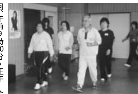
日ごろの生活に運動を

さわやか健診などで、総コレステロールや中性脂肪の値が高かった人や心配のある人を対象に、高脂血症教室を開催します。 高脂血症は、日ごろの生活習慣が原因で発症する病気で、心臓病にも影響を及ぼします。 予防の基本である食事や運動について学んでみませんか。 日時 2月3日、17日の金曜三