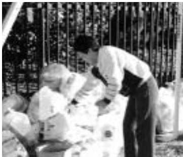
排出日をきちんと守りましょう

今号の「広報まえばし」と合わせて、平成十五年度「ごみ収集カレンダー」を配布。A3判両面で四月から来年三月までの一年分の排出日を掲載。一年間大切に保管し、「ご利用ください。」なお、「ゴミを出すときは収集