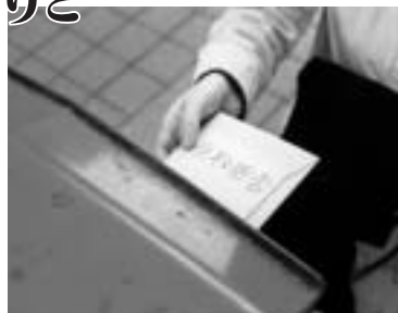
受け取り拒否は開封せずに

け取り拒否という方法があります。「受取拒否」と明記し、郵便物の受取人が署名押印した紙を郵便物に張ってポストに投かん。事業者を受取人の意思が伝えられます。ただし、開封してしまうと受け取り拒否はできません。また、差出人の住所などが書かれていないものについては、受け取り拒否すると一定期間郵便局で保管された後、廃棄されます。