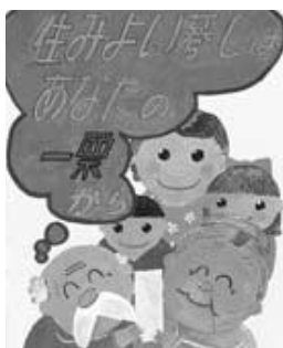
昨年度の入賞作品

内容「明るい選挙を推進する標語が入ったポスター」応募資格「小1～高3」応募規程「四つ切り(五四・二一 × 三八・二一)または八つ切り(三八・二一 × 二七・一)もしくはそれに準ずる大きさで、画材は自由。作品の裏に学校名・学年・氏名(ふりがな)・性別を記入 申し込み「9月6日 までに各学校または市役所7階選挙管理委員会事務局(890 6742)へ直接 その他「入賞作品の版權は主催者に属し、作品は選挙啓発の目的に利用 優秀作品は