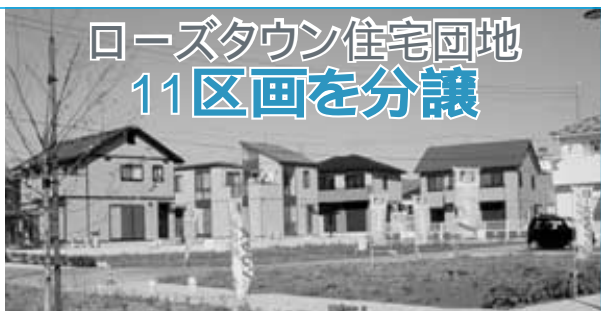
ローズタウンにマイホームを建てませんか

最近、家庭や飲食店などから 出る油類によって、下水道の本 管が詰まるトラブルが増してい ます。油脂類遮断装置(グリー