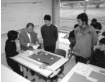
授業は実験や実習が中心