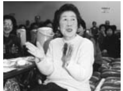
日ごろの備えで笑顔ある暮らし

容 老後における日常の金銭管理について 参加費 無料（65歳未満の人は入場料が必要）