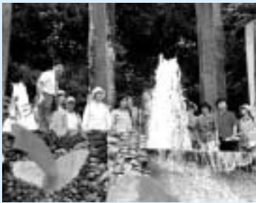
歴史を学びながら歩く

日時 9月5日 午前9時30分（雨天決行） 集合場所 JR前橋駅南口 コース 集合場所 産泰神社 大室公園 一宮赤城神社 女堀 集合場所 対象 一般、三十五人（抽選） 参加費 千円（昼食代含む） 申し込み 8月16日 までに往復八ガキで（一通） 住所・氏名・年齢・