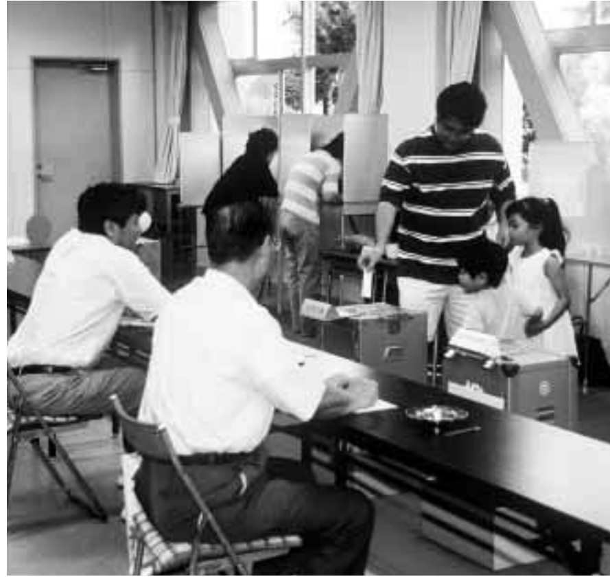
前回の衆議院議員選挙で(城東小)