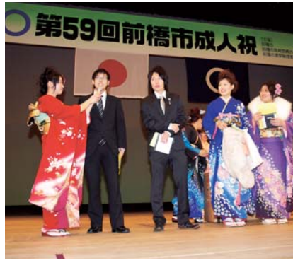
楽しい式典にしよう(昨年度)

本年度の成人祝は、来年1月13日(日)にグリーンドーム前橋で行います。この式典のプログラム検討や運営を行う委員を募集。市内各中学校卒業生の代表者24人と一緒に、思い出に残る成人祝を企画しませんか。 なお、成人祝の該当者へは12月に案内状を送付。市外転出者で本市の成人祝に参加したい人は、青少年課へ申し込んでください。 対象 次のすべてを満たす人、3人(選考)。 ①昭和62年4月2日～63年4月1日生まれ ②市内在住 ③9月から来年1月までに10回程度開く会議に出席できる 申し込み 8月10日(金)(必着)までに郵送または直接。成人祝に対する