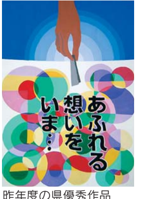
昨年度の県優秀作品

生活習慣病を予防するための教室 教室名 ①高脂血症②糖尿病③ダイエット④生活習慣病予防 日時 ①は8月17日～31日の金曜3回 ②は8月20日～9月3日の月曜3回 ③は8月22日・29日(水)・9月3日(月)④は8月21日(火)・29日(水)・9月10日(月)、午前9時30分～正午(④は午後1時30分～3時30分)