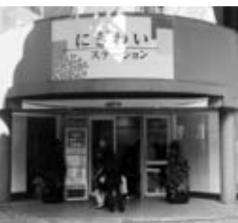
アートコンペの展示も実施

下水道事業受益者負担金の申告は、市街化区域に土地を持っている人で、下水道本管工事が完了し下水道が使用可能になった区域の人が対象です。申告が必要な人には「下水道事業受益者申告書」を郵送しました。同封されている返信用封筒で、期日までに申