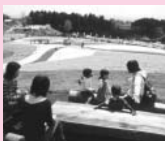
丘一面がシバザクラで

前橋テルサでロビーコンサートを開催します。入場は無料。午後のひとときを、美しい音楽でくつろぎませんか。 日時 4月15日 午後0時30分～1時 会場 前橋テルサ 内容 リコーダーの調べ 1 3211へ。