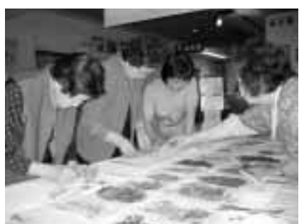
色とりどりの花を使って