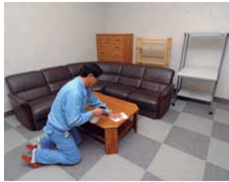
まだまだ使える家具を再利用

荻窪清掃工場へ粗大ゴミとして搬入された物の中から、まだ使うことができるソファや中古家具5点を抽選で譲ります。抽選日などは次のとおり。対象となる家具は同工場に展示していますので、下見ができます。申し込めるのは1世帯1点。中古品のため傷などもあります。現状のまま当選者へ会場で引き渡します。搬出は自己負担です。リサイクル推進のため、積極的に活用してください。なお、抽選日当日はリサイクルに関するビデオも上映します。 日時 10月8日(月)午前10時 会場 荻窪清掃工場