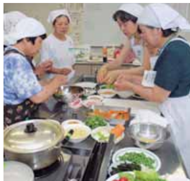
子どもに美味しい手料理を