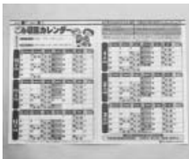
収集日をしっかり確認

布しています。届かない人は市役所清掃業務課 各支所・出張所へお越しください。また、九月下旬からは本市ホームページからもダウンロードすることができます。「ごみ収集カレンダー」を常備して収集日を確認し、ゴミは正しく出しましょう。 なお、大胡・宮城・粕川地区の「ごみ収集カレンダー」は、四月に配布した物に一年分が掲載されているので、今回は配布しません。 …問い合わせは清掃業務課 890 6272へ。