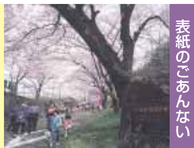
表紙のごあんない

日本の桜名所百選に選ばれている赤城南面千本桜。県外からも多くの観光客が訪れます。四月十五日に満開になりました。約二キロにわたる桜のトンネルは、お花見を楽しむ家族づれや友人同士で大にぎわい。気温が上がると桜のやさしい香りが漂いました。